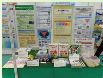
第11回川崎国際環境技術展