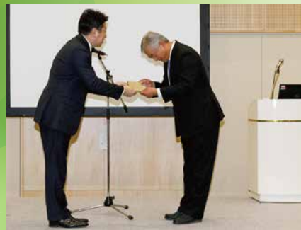
低CO 2 川崎ブランド認定事業者様には、会長から認定証、市長から楯が授与されました。(2018年度)