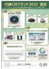
認定製品等のポスター作成