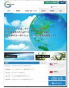
ホームページでの広報