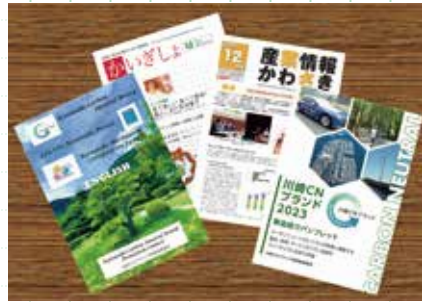
各種広報誌等に掲載