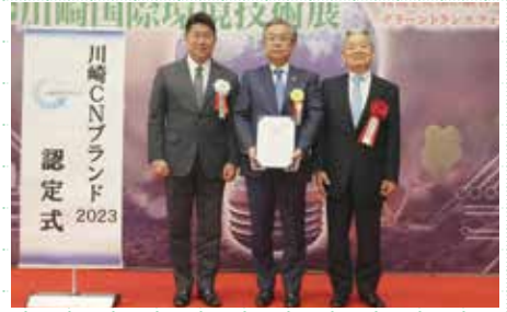
足立会長、川崎市長より認定証、楯がそれぞれ授与されました